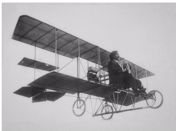
左門式飛行機・初飛行